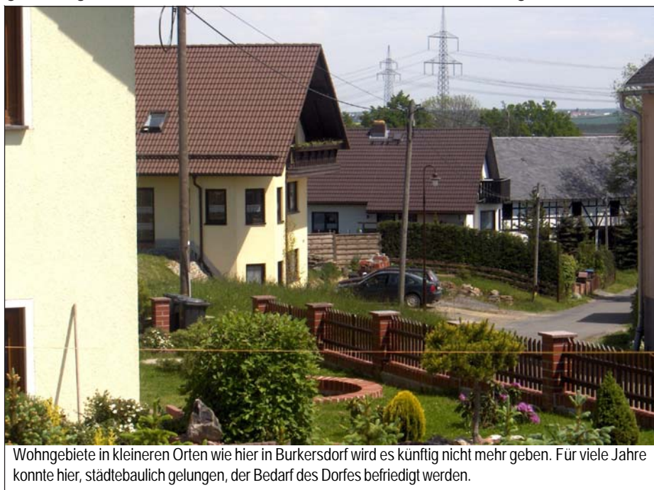
Wohngebiete in kleineren Orten wie hier in Burkersdorf wird es künftig nicht mehr geben. Für viele Jahre konnte hier, städtebaulich gelungen, der Bedarf des Dorfes befriedigt werden.

alle anderen Belange zurückstehen müssen. Vorranggebiete gibt es im Raum Tegau/Göschitz/Löhma aber auch für die Rohstoffsicherung. Gemeint sind damit die Steinbrüche Vogelsberg und Kahlleite, mit denen sich die Gemeinden über die Jahre hinweg arrangiert haben. Nicht anfreunden hingegen wollen sich die Kommunen mit den als Vorbehaltsflächen ausgewiesenen Standorten in Göschitz (Tauben-